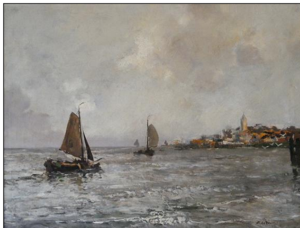
Zuiderzee voor Monnickendam, 50x65, C. de Bruin.