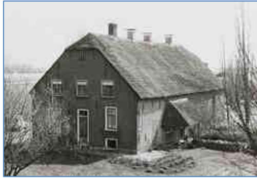
Bouwplaats Bastiaen, 1840-1917.