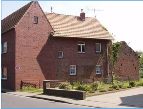
Hij leert te Schierwaldenrath het molenaarsvak