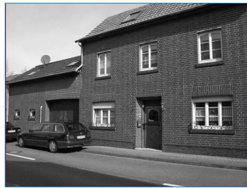
Het ouderlijk huis te Kreutzrath