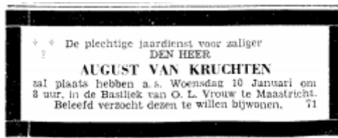
Uit: Limburger Koerier, maandag 08-01-1940.