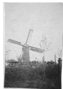
Molen aan de Prinsenbaan