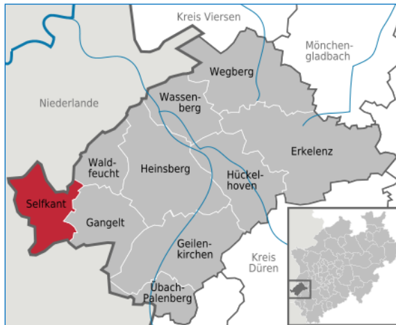
Selfkant, Kreis Heinsberg, Nordrhein-Westfalen.