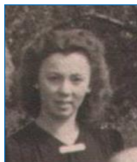
Tilla van Kr.