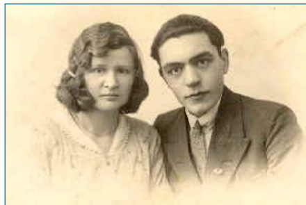
Van Kruchten x Dirks